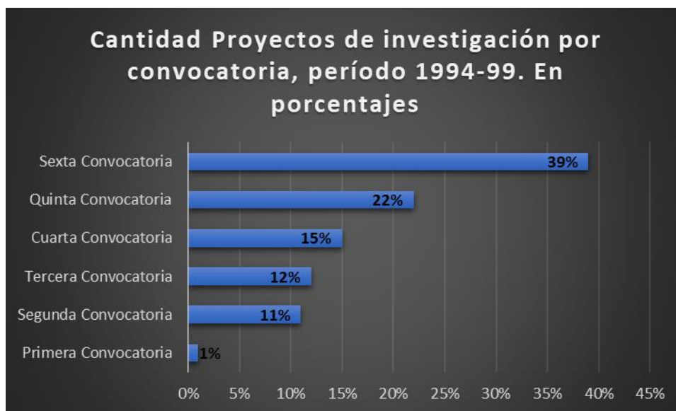
Tabla 2: Total de proyectos de investigación correspondiente al periodo (1994-1999), por universo de análisis:

Dinámica de la incorporación de proyectos de investigación al programa de incentivos en porcentajes sobre un total de 140 finalizados y en ejecución (1994-1999): 19