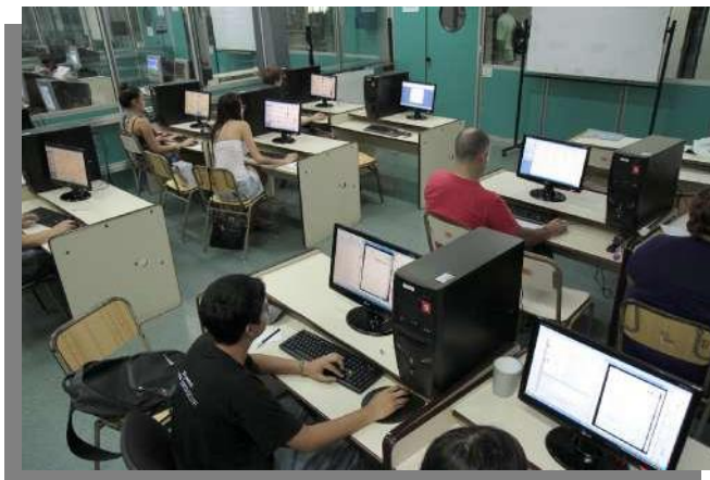
Laboratorio Sector Gral. Manuel Belgrano

En relación con el deporte y la actividad física, la Universidad tiene un campus deportivo extenso y bien provisto que cumple un rol importante para las prácticas académicas de la carrera de educación física y los equipos representativos de la Universidad. Por otro lado, este cumple una función social importante ya que el mismo es utilizado por la comunidad para desarrollar sus actividades físicas y o deportivas a las que se inscriben y las practican. El gimnasio Juan Manuel Fangio fue el primer espacio para las actividades físicas en la Universidad. En el mismo se practican deportes, como atletismo, básquet, boxeo, equitación, fútbol 11, fútbol de salón, gimnasia artística, gimnasia acrobática, hándbol, judo, karate, musculación, natación, rugby, taekwondo, tenis de mesa y vóley.