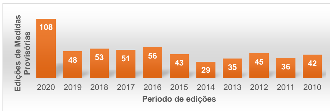
Medidas Provisórias editadas entre 2010 e 2020