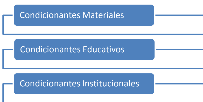
Figura 3. Condicionante del proceso de producción del trabajo final de grado. Elaboración Propia.