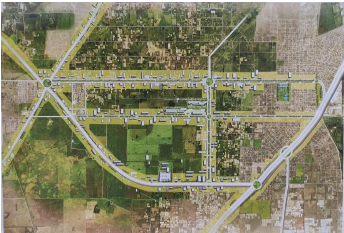
Ilustración 2. Proyección del desarrollo del Polo Agroalimentario Sustentable El Pato 2050.

El Polo se desarrollará en una región delimitada al este por la calle 637, al oeste por el límite con Florencio Varela, al Norte por la avenida Ingeniero Allan y al Sur por el límite con El Peligro (La Plata) por donde pasará la futura autopista presidente Perón. Esta región comprende aproximadamente 2000 hectáreas. En la referida región, se encuentra un predio de 29,7 hectáreas, propiedad del Municipio de Berazategui.