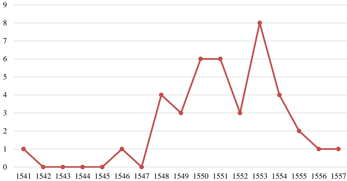
Figura N°2: La evolución de las políticas municipales a lo largo del período (1541-1557). Fuente: ACS, Libro I, pp. 83-560.